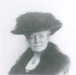
Selma Lagerlöf (1858-1940)

Tjänsteanden är hämtad ur Troll och människor I (1915). Novellen publicerades första gången i Julrosor 1911, med titeln Spirrtus .